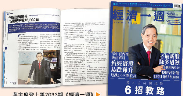
葉主席登上第2033期《經濟一週》封面，在專訪中分析港股走勢。