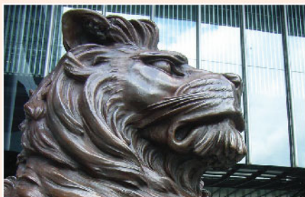
▲ 投資路上懂得在適當時候「斷捨離」非常重要。