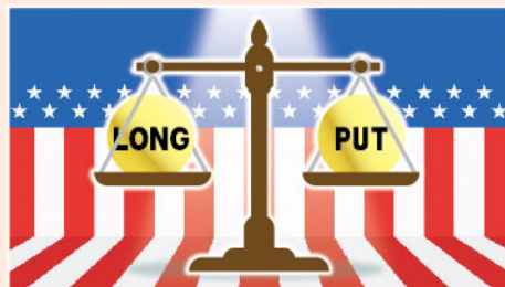
▲ 有效分配 Long Put，就能減低大選對投資的影響。

期權策略變化多端，投資者切忌死背教科書招式，我們應該針對不同的事況變招，始終人是活的，書是死的。上個月曾經提及過買入勒束式期權組合 (Long Strangle)，簡單講是同時 Long 兩邊