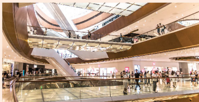
▲ 疫情對市場的影響，投資者仍需採取觀望態度。

目前市場關注內地疫情最新發展狀況，樂觀派人士認為內地疫情防控工作取得了顯著成效，新增確診人數已從高峰期回落，日均新增人數降低至千宗以下，而全國除了湖北省外亦未有社區爆發跡象，還有部分省市出現新確診病例的0增長，包括西藏，以及內蒙古、遼寧、新疆等14個省份。截止執筆一刻計，內地疫情仍未見有任何惡化跡象，但觀看香港、南韓及日本均呈現社區爆發危機，疫情於後市仍存在眾多變數，加上眾多利好預期均反映於本輪反彈浪上，投資者目前宜採取觀望態度，見步行步之態度。從技術上看，恒指此輪反彈自2月3日低位26145點升至2月17日高位28055點，升幅達1910點，只要指數於後市未有回調多過升浪的0.618，即企穩26875點之上，在市場憧憬內地推出刺激措施扶持經濟的因素支持下，目前亦不宜過份悲觀。