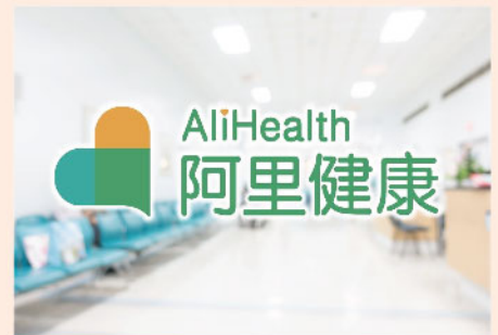
▲ 阿里健康高追風險不低，投資者宜謹慎。