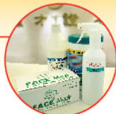
▲分行加強消毒清潔