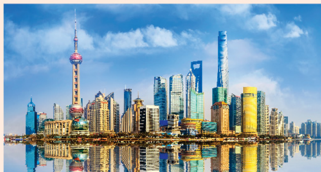
▲市場普遍認為今年內地仍存在放水空間。

此外，港交所(0388)今年開局亦有驚喜，大市成交金額顯著上升，月中日均成交金額曾突破一千億元，中概股回流港交所作第二上市成為市場焦點，帶動港交所股價顯著造好，今年港交所股價該有條件挑戰300元關口水平。