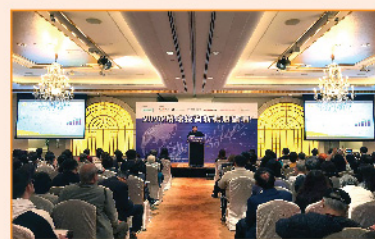
▲ 講座於早前順利舉行，全場座無虛席，現場氣氛熱烈。