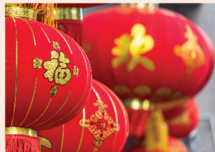
▲新年伊始，筆者為大家推介兩隻利是股。