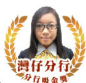
灣仔分行 分行吸金