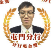
屯門分行 分行吸金