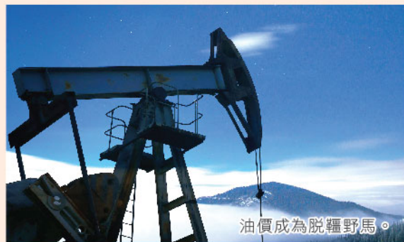
油價成為脫韁野馬。

武裝組織更表明未來攻擊石油設備將「常態化」，意味沙特石油供應將面對重大風險；其次是美國及沙特會否對伊朗展開行動。事實上筆者不太相信會演化為軍事衝突，但雙方各擺姿態(例如伊朗或會再次威脅封鎖霍爾木茲海峽)已足以支持油價繼續走強了！