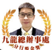
九龍總辦事處 分行吸金