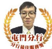
屯門分行 分行最佳服務