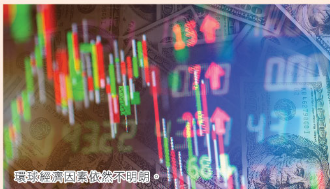
環球經濟因素依然不明朗。

從基本因素方面，目前全球經濟衰退風險未見改善，中美貿易談判能否有進展仍是未之知數，筆者維持上月提及的投資策略，除了多持現金方面外，另一選擇是是最佳選擇。投資策略方面，可考慮吸納恒指反向產品作為對沖選擇[如F12南方恒指(7500)]，面對後市不明朗，如手上持有眾多股票仍不願忍痛止蝕，以恒指兩倍反向產品作為對沖似乎是唯一選擇。