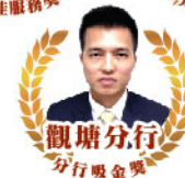
觀塘分行 分行吸金