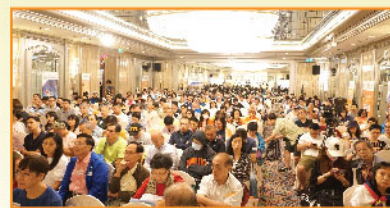
▲ 講座當日全場爆滿座無虛席，感謝客戶支持！