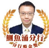
鯽魚涌分行 分行吸金獎