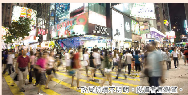
政局持續不明朗，投資者宜觀望。

筆者認為，一日香港政局仍然不明朗，建議投資者最好採取觀望態度。從歷史所見，於2014年台灣的「太陽花學運」及2010年阿拉伯的「阿拉伯之春」均會令投資者卻步，當然香港目前狀況未必能與上述事件完全相同，但假若事件毫無進展，或將會進一步連累零售及地產業。而事實上，最近已有大行報告唱淡本地零售股，啟德地皮中標價格亦低價市場預期，反映上述因素已開始於香港實體經濟上產生影響。