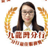
九龍灣分行 分行最佳服務獎