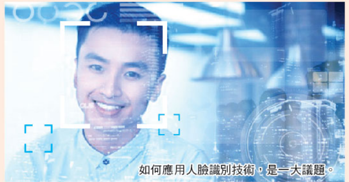
如何應用人臉識別技術，是一大議題。

術盜取用戶個人隱私，甚至會帶來性格歧視等。當然，科技發明原意是促進社會進步，但如何應用，卻是未來一大值得思考的議題。