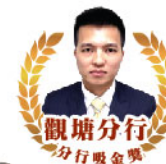
觀塘分行 分行吸金獎