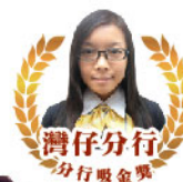
灣仔分行 分行吸金獎