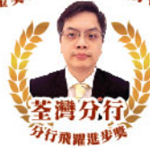
荃灣分行 分行飛躍進步獎