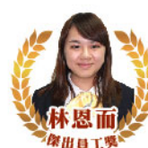
林恩而 傑出員工獎