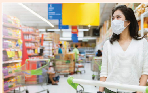
▲ 國務院12月7日公布放寬新冠病毒病防疫措施「新十條」，進一步放鬆管控措施，港股借勢反彈。

港股由十一月起吐氣揚眉，逐步復常及放寬疫情防控措施，乃意料中事，如沒有把握好此升浪的投資者，現階段才入市，值博率在20,000點前，皆因在心裡關口前大量「獲利回吐盤」湧現；如拖磨多一段時間，此形態仍未改變，升穿20,000點料非難事。一如以往每逢要跨過18,800或19,600點的大關，均要嘗試衝關數次，方可最後過關，投資者需耐心等待。