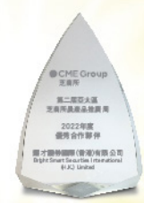
2022 年度優秀合作夥伴