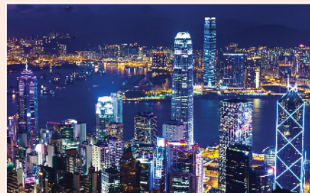
▲ 真的「全世界睇淡，反而不太淡，或有反彈」？請大家拭目以待。