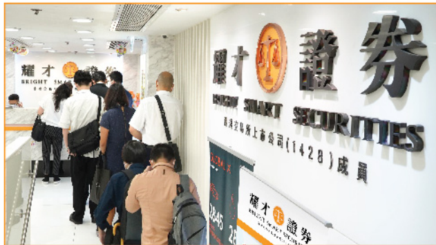
▲ 耀才逆市擴軍，招聘日人頭湧湧反應熱烈。

隨著耀才客戶群日漸壯大，為了開拓業務及持續提升服務質素，集團逆市擴充，為業務的進一步躍升做好充分的準備，及為未來市況轉好做足準備。