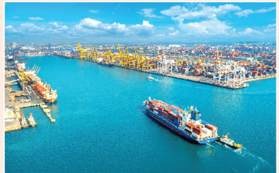
▲ 即使俄烏局勢緊張，外界相信航運運費價格仍易升難跌。

最後一個原因竟與勞動人口有關。根據國際航運商會(ICS)早前發表之一份聲明，在全球189萬船員當中，