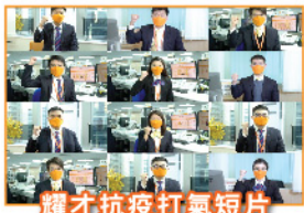
耀才抗疫打氣短片

本港爆發第五波疫情以來，確診數字屢破新高，導致本港公共醫療系統瀕臨崩潰，亦為全體醫護人員帶來前所未見的龐大壓力。耀才證券主席葉茂林先生創辦的「葉茂林慈善基金」繼2020、2021年後，今年再次捐出一千萬元予醫管局，連續三年合共捐出3000萬。除此以外，耀才製作了全新一輯的抗疫打氣短片，為全體醫護人員打氣，衷心感謝他們的無私奉獻，堅守崗位，呼籲港人齊心抗疫，戰勝疫情！