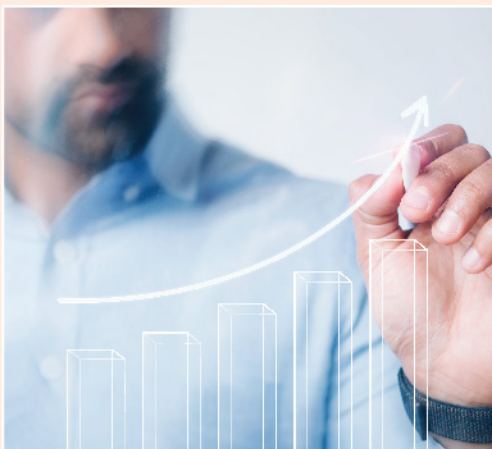
▲ 恒指回升，唯現階段評論熊市已結束仍言之尚早，經濟前景仍充滿挑戰性，投資策略上仍該比較審慎。