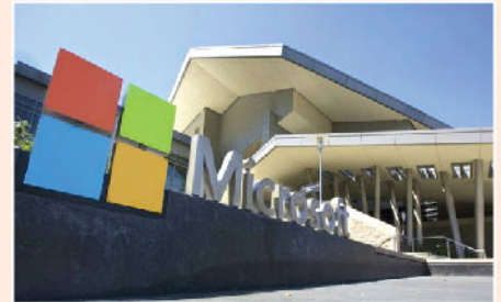
▲ 微軟是現時市值最高之上市企業。

有相當技術人材以及雄厚財力，要發展元宇宙幾乎不太可能，亦因此認為微軟確有本事未來在此範疇分一杯羹。所以筆者會繼續視微軟為其中一隻長線投資之好股，目標持有一年或以上。